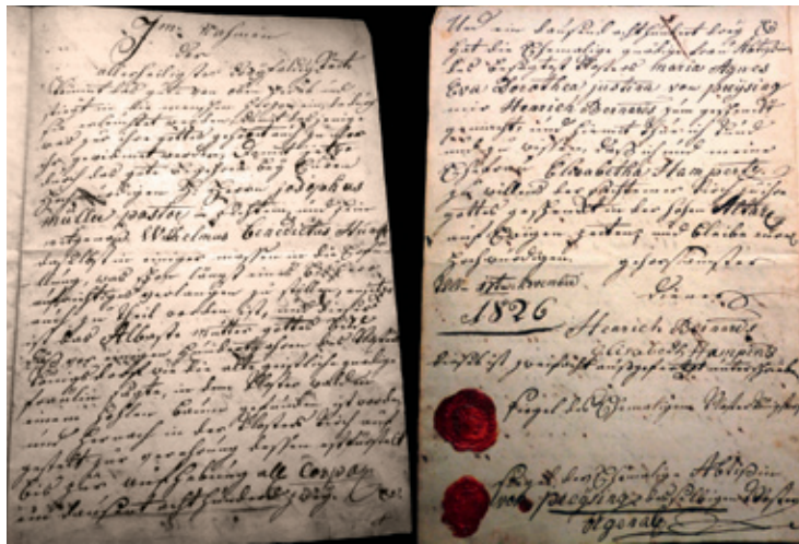
Schenkungsurkunde 17. November 1826 Pfarrarchiv Sechtem, Signatur 188

aufgesetzt, nämlich im Namen der Allerheiligsten Dreifaltigkeit beginnend und versehen mit dem Siegel der ehemaligen Äbtissin und dem sog. Kleinen Siegel des Königsdorfer Klosters, trägt die Urkunde die Unterschrift der Eheleute. Kann man annehmen, dass die Äbtissin ihren ehemaligen Bediensteten auch die Siegel anvertraut hatte? Ob diese in der Lage gewesen waren, einen derartigen Urkundetext aufzusetzen, darf man wohl bezweifeln. Mit der Übergabe der Statue an den Pastor Müller haben sie nach Auskunft des Pfarrers Müller den Wunsch der Äbtissin erfüllt, selbst wenn sie nach ihrem damaligen Stande nicht in der Lage gewesen sein sollten, die